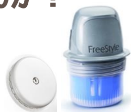
血糖管理ツール“Free Styleリブレ”

24時間×2週間、グルコース値を測定し、 食後高血糖など、健康診断では見つかりにくい 「血糖値スパイク」の把握が可能です